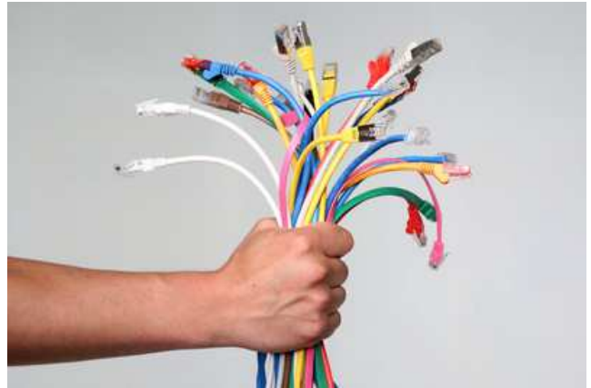
Haben Sie Ihre IT im Griff?

In der IT geht es oft darum, etwas zu regeln. Geschieht das nicht, kommt es zu Problemen und in den schlimmsten Fällen sogar zu Haftungsrisiken. Wenn Sie vor einer solchen Entscheidung stehen, hilft Ihnen vielleicht die 3-Way-Regel weiter. In drei konkreten Schritten kommen Sie zu einer Lösung.