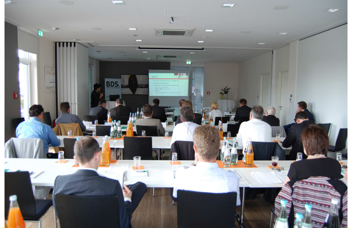
Der diesjährige BDS Landesverbandstag findet am 10. Oktober in Ludwigshafen statt.

Im Rahmen der Generalversammlung stehen turnusgemäß die Neuwahl des Präsidiums und der Beisitzer an. BDS Mitglieder die sich engagieren möchten, können sich bei der BDS Geschäftsstelle melden. Eines der Highlights des Tages wird die politische Diskussionsrunde, die um 15:30 Uhr stattfindet. Moderiert wird die Runde vom SWR-Journalisten Thomas Leif. Das Publikum hat die Möglichkeit Fragen zu stellen. Die Diskutanten sind Spitzenvertreter der rheinland-pfälzischen Landespolitik. Eine schriftliche Einladung geht allen BDS Mitgliedern demnächst zu. Melden Sie sich an, kommen Sie nach Ludwigshafen und gestalten Sie die Zukunft des BDS gemeinsam mit uns.