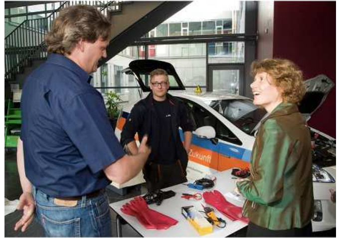
An der Aktionswoche 2013 nahmen über 100 Projekte teil.

bereitgestellt, so dass nur geringe Kosten für die Teilnehmer entstehen. Anmeldeschluss ist der 23. Mai. Mehr Informationen finden Sie auf: http://www.energieagentur.rlp.de/aktionswoche.html