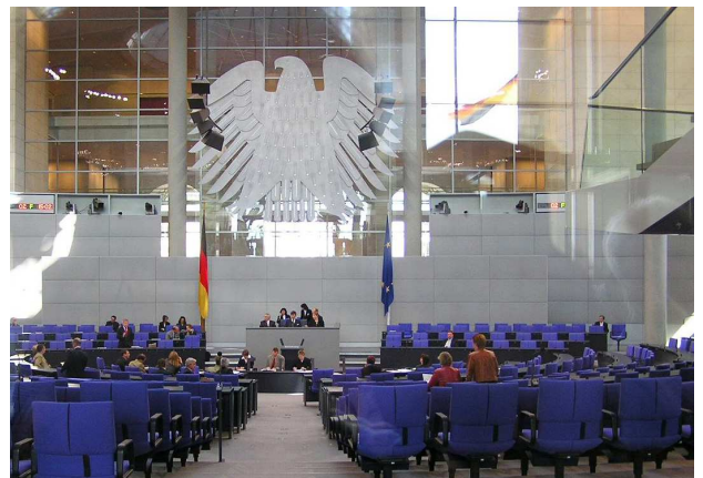
Der Bundestag wird durch die Große Koalition dominiert.

Was haben die Selbständigen nicht alles im Wahlkampf gehört. Von der „wichtigen Säule“ der Gesellschaft wurde da auf den Marktplätzen landauf, landab gesprochen. Von den „Leistungsträgern“, die entlastet werden müssen. Übrig geblieben ist davon so gut wie nichts. Nicht Reformen und Erleichterungen für den Mittelstand, sondern soziale Wohltaten wie das Rentenpaket oder internationale Konflikte bestimmen die Schlagzeilen. Dabei gäbe es zahlreiche Felder, in der die Politik konkret etwas für kleine und mittlere Unternehmen tun könnte – allein der Wille scheint zu fehlen.