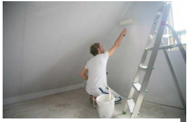
Die Unternehmergeellschaft (haftungsbeschränkt) wird von vielen Existenzgründern genutzt.

Eine Studie der Universität Jena zeigt, dass mittlerweile rund 100 000 Mini-GmbHs gegründet wurden, alleine 2013 waren es 14 700 UGs. Stellt man diesen Zahlen die 2399 Insolvenzfälle von Unternehmergeellschaften entgegen zeigt sich, dass die UG eine seriöse und bedenkenswerte Gesellschaftsform für Selbständige ist. Hier hat die Politik einen guten Rahmen gesetzt um Existenzgründungen zu fördern.