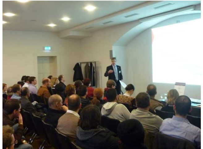
Auf die Besucher des Existenzgründungstages wartet ein vielfältiges Programm.