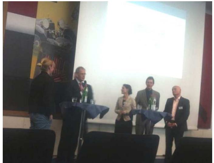
Über verschiedene Konzepte diskutierten die Teilnehmer der Fachtagung zum Thema Innenstadtentwicklung.