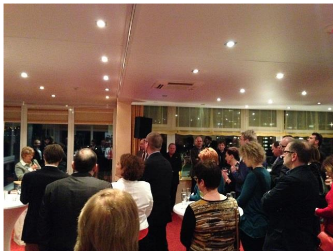
Die BDS Neujahrsempfänge finden in Neustadt und Saarbrücken statt.

Gleich mit zwei Neujahrsempfängen, einem Neujahrsempfang in Rheinland-Pfalz und ein Empfang im Saarland, startet der Bund der Selbständigen Rheinland-Pfalz & Saarland e.V. ins neue Jahr. In Neustadt findet der Neujahrsempfang am 17. Januar 2018 um 19:30 Uhr im Panorama Hotel, Mußbacher Landstraße 2, statt. Eine Woche später, am 24. Januar 2018 um 18:30 Uhr lädt der BDS zum Empfang auf dem Schiff "Stadt Saarbrücken", das am Schiffsanleger am saarländischen Staatstheater in Saarbrücken auf seine Gäste wartet. Die Neujahrsempfänge sind eine gute Gelegenheit sich mit anderen Selbständigen auszutauschen, neue Geschäftskontakte zu knüpfen und zu erfahren was der BDS im Jahr 2018 plant. Um Anmeldung wird gebeten. Für die Anmeldung zur Veranstaltung oder weitere Informationen kontaktieren Sie bitte die Geschäftsstelle unter Telefon: 06321/9375141 oder E-Mail: info@bds-rlp.de