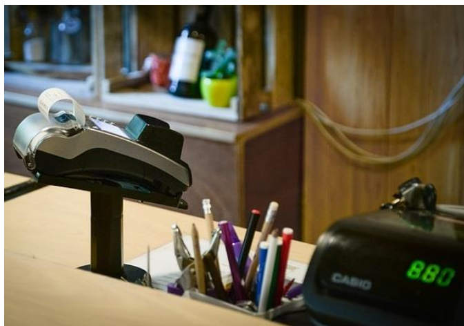
Seit dem 1.1.2018 finden verstärkt Kontrollen statt.

Seit Anfang 2018 besteht für das Finanzamt eine neue Möglichkeit, Betriebe zu überprüfen, die Bar-einnahmen haben und dementsprechend eine Kasse führen. Die so genannte Kassen-Nachschau nach § 146b AO berechtigt Beamte der Finanzbehörde nun, unangekündigt zu den üblichen Geschäftszeiten eine Kassenprüfung in den Geschäftsräumen des Betriebs durchzuführen. Geprüft wird die Ordnungsmäßigkeit der Aufzeichnungen und Buchungen von Kasseneinnahmen und Kassenausgaben. Den Prüfern ist ein umfassender Einblick in die Aufzeichnungen, Bücher sowie die für die Kassenführung erheblichen sonstigen Organisationsunterlagen zu gewähren. Liegen die Daten nur in elektronischer Form vor, so muss der Betrieb auf eigene Kosten dafür sorgen, dass der Beamte dennoch uneingeschränkter Zugang zu den Unterlagen bekommt. Sollten im Zuge dieser Prüfung Unregelmäßigkeiten auffallen, kann ohne vorherige Anordnung zu einer Betriebsprüfung übergegangen werden. Betriebe, die eine Kasse führen, sollten also spätestens ab jetzt sehr genau Buch über die Ein- und Ausgaben führen, um Unannehmlichkeiten zu vermeiden.