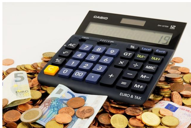
Die Forderung Selbständige in die gesetzliche Rente einzubeziehen ist vom Tisch.

Die Selbständigen in Deutschland werden auch in Zukunft die Wahl haben wie sie ihre Altersvorsorge betreiben. Ein Zwang zum Eintritt in die gesetzliche Rentenversicherung, wie in der letzten Legislaturperiode unter anderem von Arbeitsministerin Andrea Nahles (SPD) gefordert, ist vom Tisch. Das geht aus dem Sondierungspapier von CDU, CSU und SPD hervor. Beschlossen wurde eine Altersvorsorgepflicht für Selbständige, die jedoch individuell ausgestaltet werden kann. Der Bund der Selbständigen Rheinland-Pfalz & Saarland e.V. begrüßt diesen Kompromiss.