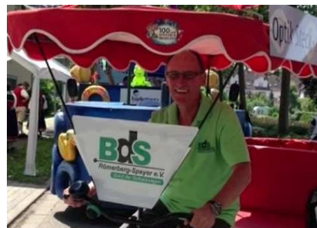
Der Brezelfestumzug findet am 10. Juli statt.

Der BdS Römerberg-Speyer e.V. wird auch in diesem Jahr wieder mit einer Fußgruppe beim traditionellen Brezelfestumzug am 10. Juli teilnehmen. Anmeldungen werden noch bis zum 30. Juni entgegen genommen. „Mit der Teilnahme am Brezelfestumzug möchten wir die Bekanntheit des BdS weiter steigern und die enge Verbindung zwischen den Unternehmen und der Stadt zeigen. Außerdem ist es für die teilnehmenden Selbständigen auch eine schöne Möglichkeit ihr Unternehmen zu präsentieren“, erklärt die Vorsitzende des BdS, Liliana Gatterer. Anmeldungen nimmt die BDS Geschäftsstelle unter 06321/9375141 oder info@bds-rlp.de entgegen.