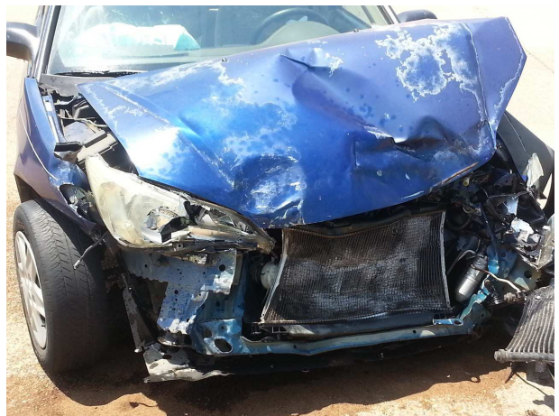
Bei einem Unfall gibt im Umgang mit Unfallgegnern und Versicherungen einiges zu beachten. Unsere Experten informieren Sie.

Für die Anmeldung zur Veranstaltung oder weitere Informationen kontaktieren Sie bitte die Geschäftsstelle unter Telefon: 06321/9375141 oder E-Mail: info@bds-rlp.de .