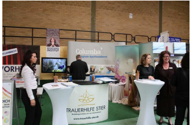
Die Leila findet am 28. und 29. Mai 2016 in Lambrecht statt.

Es sind noch Ausstellungsflächen frei. Alle Selbständigen sind herzlich eingeladen als Aussteller an der Leistungsschau teilzunehmen. Präsentieren Sie Ihre Produkte und Dienstleistungen den Besuchern aus der Verbandsgemeinde Lambrecht, Neustadt und der Region. Für die Aussteller ist die Anmeldung eines Standes ab sofort möglich. Das Anmeldeformular kann bei der Geschäftsstelle des Bund der Selbständigen, Lindenstraße 9-11 in Neustadt abgeholt oder unter 06321-9375141 und info@bds-rlp.de angefordert werden.