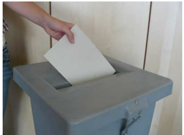
Rund 2 Millionen Rheinland-Pfälzer waren am 13. März aufgerufen den neuen Landtag zu wählen.

„Das Tempo beim Ausbau des schnellen Internets muss deutlich gesteigert werden sonst werden ländliche Gebiete abgehängt. Es braucht Investitionen in Straßen und Brücken, sowohl die zweite Rheinbrücke bei Wörth als auch die Mittelrheinbrücke müssen endlich realisiert werden“, beschreibt Liliana Gatterer, Präsidentin des Bund der Selbständigen Rheinland-Pfalz und Saarland e.V. die Forderungen der Wirtschaft an die Politik. Auch in Bezug auf die Bildung hat der Bund der Selbständigen klare Forderungen: „Politik, Schulen und die Wirtschaft vor Ort müssen gemeinsam daran arbeiten, dass junge Menschen sich für eine duale Ausbildung entscheiden. Nur so stärken wir die kleinen Betriebe und das Handwerk in Rheinland-Pfalz. Dazu gehört auch die Gebührenfreiheit bei der Meisterausbildung“, sagt Gatterer. Den Einzug der Alternative für Deutschland (AfD) in den Mainzer Landtag bedauert der Bund der Selbständigen. „Eine Partei die vor allem davon lebt Ängste und Ressentiments gegen Fremde zu schüren liegt unserer freiheitlichen Art zu leben fern“. sagt die BDS Präsidentin.