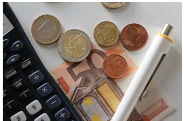
Das Mindestlohngesetz muss dringend reformiert werden.