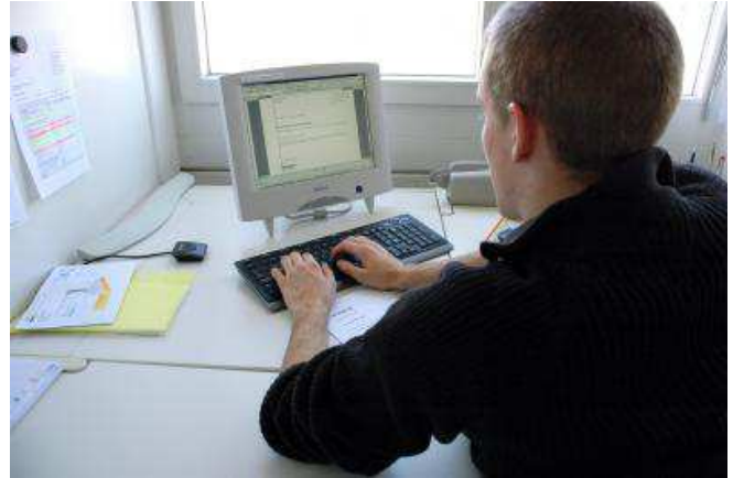
Das gemeinsame Bearbeiten von Dokumenten in der Cloud ist heute schon in vielen Unternehmen selbstverständlich.

Die Zeichen stehen klar in Richtung "Cloud", dem Speichern von Daten auf externen Servern. Jederzeit und überall Zugriff auf die benötigten Daten, das ist praktisch und kann die Zusammenarbeit erleichtern. Nur chronische Paranoiker - zu denen ich mich eindeutig zähle - glauben, dass es den Anbietern darum geht, Zugriff auf eben diese Daten zu bekommen. Der Normalbürger dagegen nutzt Dropbox & Co. schon lange und sieht darin in der Tat eine Erleichterung. Über Datenschutz und Vertraulichkeit wird selten nachgedacht. Es gibt aber auch ein praktisches Thema mit Blick auf die Zusammenarbeit. Oft werden Cloudspeicher genutzt, um gemeinsam auf Dokumente zugreifen zu können. Der Architekt stellt seine Pläne dem Bauträger und den Handwerkern