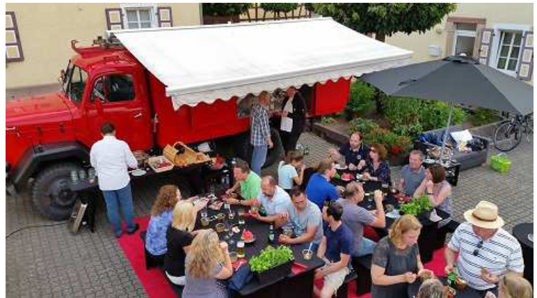
Die After-Work-Party war sehr gut besucht.

Die zweite After-Work-Party des BdS Römerberg-Speyer e.V. war erneut ein voller Erfolg. Gastgeber war dieses Mal die Firma Werbung & Drumherum aus Römerberg. Rund zwei Dutzend Selbständige waren der Einladung des BdS nach Römerberg gefolgt und erlebten dank der tollen Gastgeber von Werbung & Drumherum einen schönen Abend. Ein Highlight war das historische „Gruppen-durst Löschfahrzeug“ der Firma Getränke Oase Baumann aus Speyer. Ein umgebautes Feuerwehrauto aus dem Jahre 1965, renoviert und zur fahrbaren Ausschankstelle umgebaut.