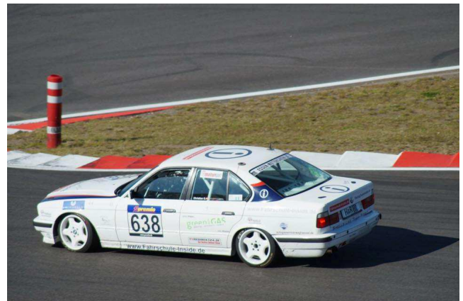
Die offenen Handwerkerrechnungen am Nürburgring sind ein Dauerthema.

Nun wird der BDS Kontakt mit dem rheinland-pfälzischen Finanzministerium aufnehmen und sich dafür einsetzen, dass die betroffenen Betriebe zu ihrem Geld kommen. Ein kleiner Schritt in die richtige Richtung ist getan.