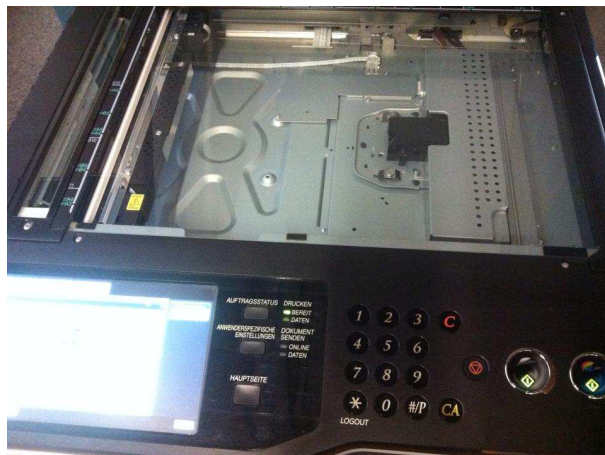
Drucker speichern Daten auf Festplatten und sind somit ein potenzielles Risiko.

Wir können aber darauf achten, dass die von uns genutzten Geräte sicher gelöscht werden, bevor sie in andere Hände gelangen.