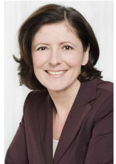
Ministerpräsidentin Malu Dreyer lädt den BDS nach Mainz ein.