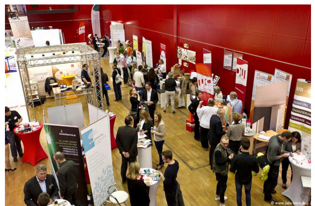
1500 Besucher kamen zur Ignition in Mainz.

Zum 12. Mal fand in Mainz mit der Ignition die größte Gründermesse in Rheinland-Pfalz und dem Rhein-Main Gebiet statt. Der Bund der Selbständigen Rheinland-Pfalz und Saarland e.V. war erstmals mit einem Stand vertreten und mit der Resonanz der Besucher sehr zufrieden. Die Besucher der Ignition konnten sich bei über 100 Ausstellern und in 20 Workshops in der Mainzer Rheingoldhalle zu Themen rund um Gründung und Selbständigkeit informieren. „Wir haben festgestellt, dass die Nachfrage nach einem Netzwerk und dem Austausch mit anderen Unternehmen sehr hoch ist. Dementsprechend werden wir im Jahr 2016 auch in Mainz ein Unternehmerfrühstück anbieten“, fasst Tim Wiedemann vom Bereich Presse und Kommunikation den Messetag zusammen.