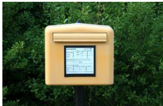
Die Deutsche Post plant eine Erhöhung des Portos.

Ein deutlicher Preisanstieg kommt auf die Kunden der Deutschen Post zu. Die Post plant eine Erhöhung des Preises für einen Standardbrief von derzeit 62 Cent auf 70 Cent. Bereits zu Beginn des laufenden Jahres hatte die Post ihre Preise angehoben. Eine endgültige Entscheidung wird Ende November erwartet. Die Erhöhung zum 1. Januar soll die letzte bis zum Jahr 2018 sein. Trotz der Liberalisierung des Postmarktes vor einigen Jahren ist die Deutsche Post mit Abstand der Marktführer beim Briefversand.