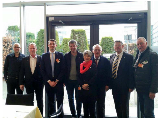
Vertreter des BDS Deutschland mit dem Bundestagsabgeordneten Dieter Janecek.

sinnvoll Handelshemmnisse abzubauen und einen möglichst unbürokratischen Wirtschaftsraum zu schaffen. Allerdings ist der Verhandlungsprozess in unseren Augen viel zu intransparent. Wir befürchten, dass dieses Abkommen vor allem den großen, exportorientierten Konzernen nützt und die kleinen Betriebe nichts davon haben. Bis heute habe ich von keiner Seite gehört, welchen Nutzen TTIP für die Selbständigen haben soll“. Neben den Vertretern des BDS Rheinland-Pfalz und Saarland nahmen auch die BDS Landesverbände Mecklenburg-Vorpommern und Thüringen am Gespräch teil. Weitere Bilder finden Sie unter http://bund-der-selbstaendigen.de/bilder/