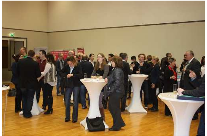
Die Selbständigen nutzten das Unternehmertreffen Pfalz um neue Kontakte zu knüpfen.