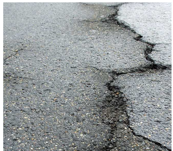
Die Fechinger Talbrücke ist seit Gründonnerstag für den Verkehr gesperrt.