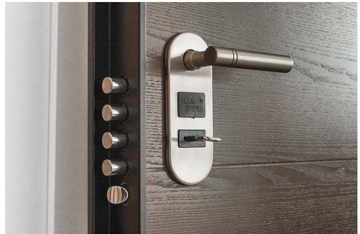
Die KfW-Bank fördert unter anderem einbruchshemmende Türen.

Neu ist, dass Eigentümer und Mieter neben Zuschüssen nun auch zinsgünstige Kredite für die Förderung von einzelnen Einbruchschutzmaßnahmen in Höhe von bis zu 50.000 Euro pro Wohneinheit in Anspruch nehmen und bei ihrer Hausbank beantragen können. Weitere Informationen erhalten Sie unter www.kfw.de oder unter der kostenfreien Servicenummer 0800 539 9002.