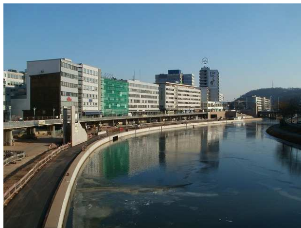
Auch in Zukunft regiert eine schwarz-rote Koalition im Saarland.

Außerdem sollen bei öffentlichen Vergaben zukünftig verstärkt das wirtschaftlichste und nicht das billigste Angebot den Zuschlag bekommen. Das Handwerk soll durch einen Meisterbonus gestärkt werden, wie dieser ausgestaltet werden soll ist allerdings noch unklar. Die Koalition bekräftigt in ihrer Vereinbarung erneut die Ablehnung der Einführung der Pkw-Maut ohne Ausnahmen für die Grenzregionen. „Der Koalitionsvertrag bietet einige Ansatzpunkte für unsere Gespräche mit der Landesregierung. Allerdings fehlt es uns an konkreten Projekten, hier wollen wir Akzente setzen und spürbare Verbesserungen für die Selbständigen im Saarland erreichen“, sagt die Präsidentin des BDS Rheinland-Pfalz und Saarland e.V., Liliana Gatterer, mit Blick auf den Koalitionsvertrag.