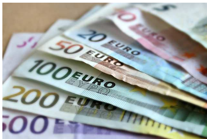
Bund, Länder und Kommunen erwarten Rekordsteuereinnahmen.

Eine genaue Vorstellung was mit dem Geld nicht passieren sollte hat der BDS auch. „Wir wollen keine teuren Prestigeprojekte und Investitionen in kommunale Unternehmen, die dadurch massive Wettbewerbsvorteile gegenüber privaten Unternehmen haben“, sagt die Präsidentin des BDS.