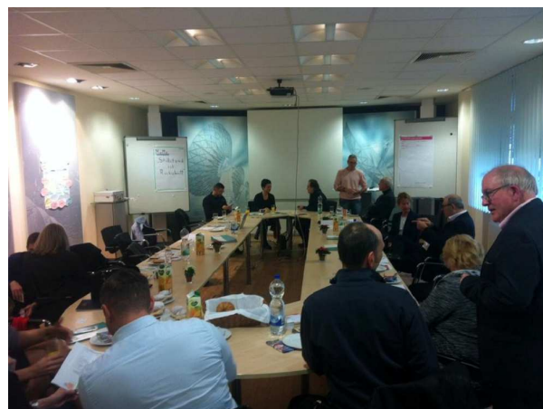
Das BDS Unternehmerfrühstück ist eine gute Gelegenheit neue Geschäftskontakte zu knüpfen.