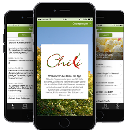
Chili-die App läuft auf iOS und Android.