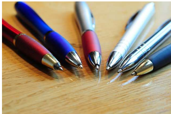
Kugelschreiber sind der beliebteste Werbeartikel.

Seit Jahren liegt der Umsatz von Werbeartikeln auf hohem Niveau. Rund 3,5 Milliarden Euro gaben deutsche Unternehmen 2013 für sie aus. Nur beim Fernsehen läuft es mit über vier Milliarden Euro noch besser. Doch worin liegen die Stärken der Werbeartikel gegenüber TV-, Print- oder Radiowerbung? Lohnt es sich für Unternehmen auf die Produkte zu setzen? Die Antwort ist laut dem aktuellen Werbeartikel Monitor ganz eindeutig: Ja!