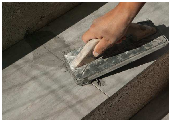
Die Große Koalition hat sich auf die Eckpunkte für eine Reform des Gewährleistungsrechtes geeinigt.

Bei den Verhandlungen des Gewährleistungsrechtes sind zwei zentrale Anliegen des Bund der Selbständigen Deutschland berücksichtigt worden. Der Unterschied zwischen verbauten und verarbeiteten Produkten wird aufgehoben, so dass eine mangelhafte Farbe rechtlich genauso behandelt wird wie ein mangelhafter Parkettboden. Auch die Forderung die Entscheidung über die Nacherfüllung beim Handwerker zu lassen wurde erfüllt. Keine Einigung konnte bei der sogenannten AGB-Festigkeit erzielt werden. Der BDS Deutschland hatte gefordert die Regelungen zu den Ein- und Ausbaurkosten so auszugestalten, dass sie in den Allgemeinen Geschäftsbedingungen nicht ausgeschlossen werden können. „Wir haben in den vergangenen Jahren mit zahlreichen Politikern gesprochen, an Anhörungen teilgenommen und öffentlich auf das Problem aufmerksam gemacht. Deshalb bin ich froh, dass es nun endlich eine Lösung für das Problem der Ein- und Ausbaurkosten gibt. Der Kampf von ZDH, BDS und den anderen Initiativen hat sich gelohnt“, sagt Ralf Vowinkel, Sprecher des AK Handwerk beim BDS Deutschland. Das Gesetz soll im März durch den Bundestag verabschiedet werden. Der BDS Rheinland-Pfalz und Saarland e.V. ist Mitglied im BDS Deutschland und kann so die Interessen der Mitglieder auch auf Bundesebene vertreten.