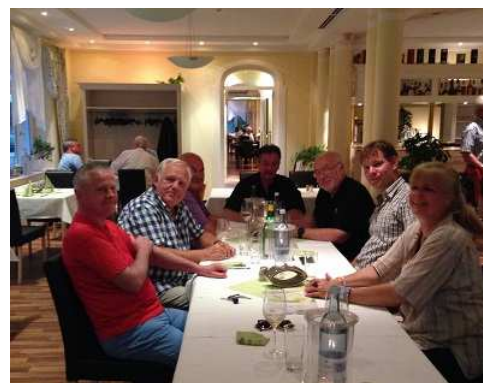
Auf dem Programm stand ein gemeinsames Abendessen der Vorstände.