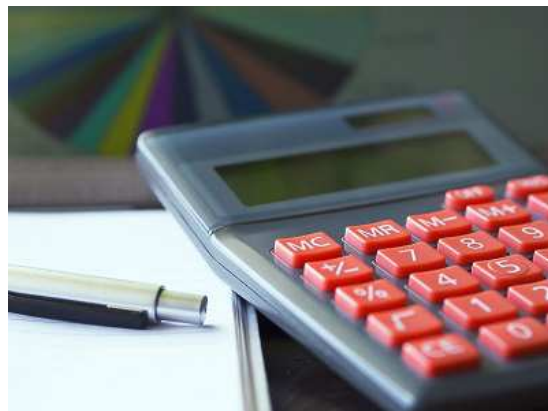
Die Bundesregierung plant eine Entlastung bei der Bürokratie für Unternehmen.